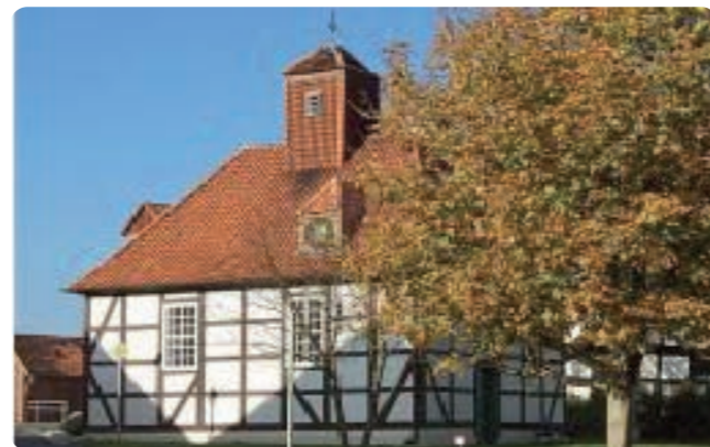
Druckerei Braunschweig, Hannover