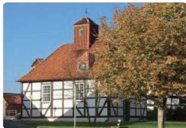
Druckerei Braunschweig, Hannover